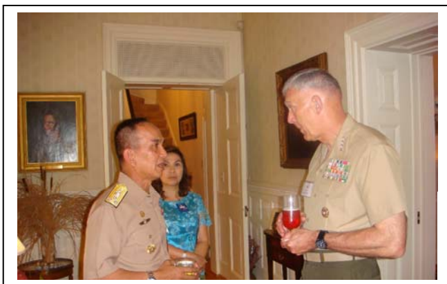
งานเลี้ยงต้อนรับ ณ บ้านพัก ผบ.นย.สหรัฐฯ

เป้าหมายสำคัญประการหนึ่งของการประชุมในครั้งนี้คือการเสริมสร้างความสัมพันธ์ ดังนั้นตลอดการประชุมจึงมีกิจกรรมทางด้านสังคมหลายโอกาส เช่น งานเลี้ยงต้อนรับ (Ice Breaker) ในคืนวันที่ ๘ มิ.ย. การชมกีฬาที่สนามกีฬาและอาหารค่ำ (Tailgate Dinner) ในค่ำวันที่ ๙ มิ.ย. งานเลี้ยงอาหารค่ำอย่างเป็นทางการ (Dinner) ในค่ำวันที่ ๑๑ มิ.ย. และงานเลี้ยงอาหารค่ำพร้อมกับการสวนสนามเพื่อเป็นเกียรติ (Evening Parade) ในค่ำวันที่ ๑๓ มิ.ย. ฯลฯ ซึ่งในแต่ละกิจกรรมเปิดโอกาสให้ ผบ.นย.ประเทศต่างๆ รวมทั้งนายทหารชั้นผู้ใหญ่ของกองทัพสหรัฐฯ ที่ได้รับเชิญมาร่วมงาน ได้พบปะ พูดคุย แลกเปลี่ยนความคิดเห็น ซึ่งเป็นก้าวสำคัญในการเสริมสร้างความสัมพันธ์อันดีต่อกันในอนาคต