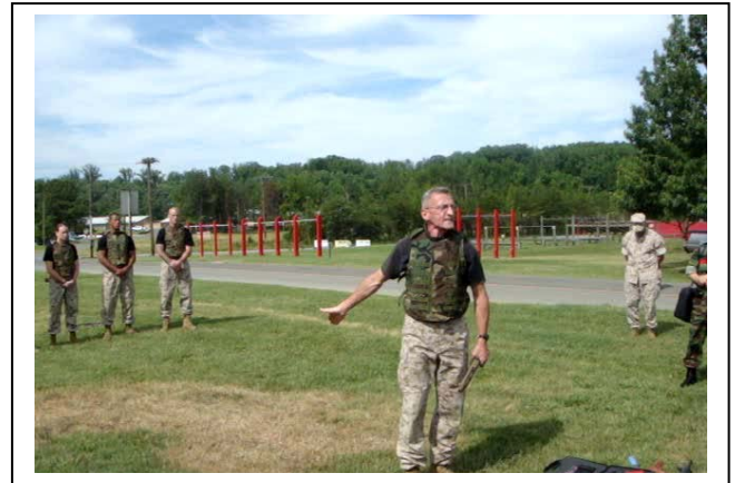
การสาธิตต่อสู้ป้องกันตัวด้วยมือเปล่าๆ