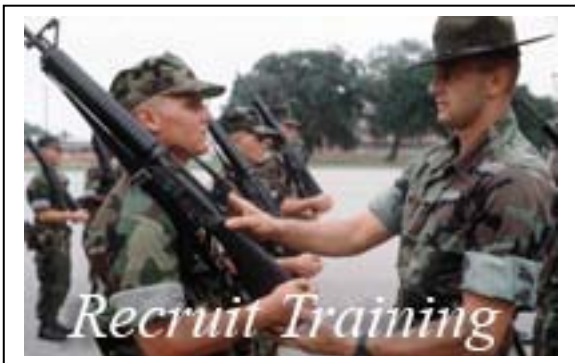
Train The Trainer.. Drill Instructor School

สถาบันแห่งนี้เป็นหน่วยงานหนึ่งภายใต้ศูนย์ฝึกพลทหาร เป็นสถาบันที่มีหน้าที่ผลิตครูฝึก ซึ่งเป็นนายทหารชั้นประทวนที่ได้รับการคัดเลือกมาปฏิบัติงานที่ศูนย์ฝึกพลทหาร โดยมีวัตถุประสงค์เพื่อพัฒนาความเป็นผู้นำ เพิ่มขีดความสามารถในการถ่ายทอดความรู้ เสริมสร้างสมรรถภาพทางร่างกาย และปรับแนวทางการฝึกเป็นไปในแนวทางเดียวกัน ฯลฯ ทั้งนี้เพื่อให้ผู้ที่เป็นครูฝึกมีคุณสมบัติเหมาะสมที่จะทำหน้าที่ได้อย่างมีประสิทธิภาพ ระยะเวลาการอบรม ๑๒ สัปดาห์ เปิดการอบรมปีละ ๔ รุ่นๆ ละ ๘๐ นาย สำหรับผลพวงจากการไปเยี่ยมสถาบันแห่งนี้ ผบ.นย.มีความเห็นว่าเป็นสถาบันที่น่าสนใจที่ควรเอารูปแบบการฝึกและความจริงจังในการทำหน้าที่ของครูฝึก มาปรับปรุง พัฒนา นย.ไทย จึงได้ประสานงานกับทางฝ่ายนย.สหรัฐฯ เพื่อส่งนายทหาร นย.ไปดูงานเพื่อนำแนวคิดต่าง ๆ มาปรับปรุง นย.ไทยต่อไป