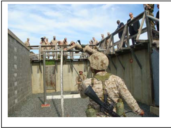
การฝึก LRC ของนักเรียน OCS