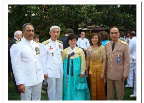
Evening Parade..... งานเลี้ยงและสวนสนามเพื่อเป็นเกียรติ