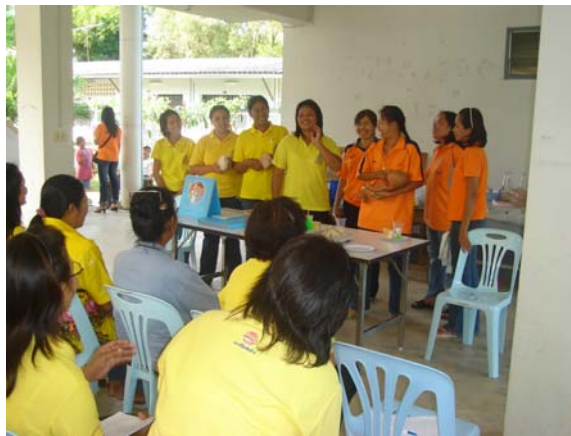
ภาพที่ แม่อาสาในกลุ่มนมแม่ฯ สาธิตการให้นมแม่ที่ถุกวิธีแก่แม่อาสาในกลุ่มนมแม่องค์การบริหารส่วนตำบล เกาะขวาง

3.3 การฝึกทักษะจริงในการเป็นวิทยากรช่วยในชุมชน ในการจัดอบรมเชิงปฏิบัติการให้แก่แม่อาสาในกลุ่มนมแม่ขององค์การบริหารส่วนตำบลเกาะขวาง ในวันที่ 25 พฤศจิกายน และวันที่ 3 ธันวาคม พ.ศ. 2549 โดยเป็นวิทยากรสอนและสาธิตทักษะพื้นฐานในการเลี้ยงลูกด้วยนมแม่ โดยแม่อาสาในกลุ่มนมแม่และพ่ออาสาที่เป็นข้าราชการทหารในโครงการฯ ได้ แบ่งกลุ่มฝึกทักษะให้แก่ แม่อาสาในกลุ่มนมแม่ ที่เข้าประชุมทั้งหมด 35 คน