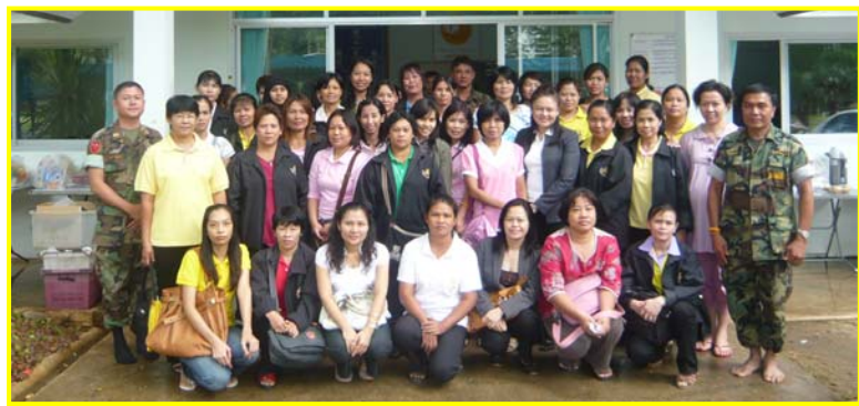
ภาพที่ บุคลากรจากโรงพยาบาลแม่สอด จังหวัดตากเดินทางมาศึกษาดูงานการดำเนินงานใน โครงการแม่อาสาฯกลุ่มนมแม่ฯพื้นที่ค่ายตากสิน แบ่งมาดูงาน 2 รุ่น ในวันที่ 9 และ 23 พฤษภาคม พ.ศ. 2551