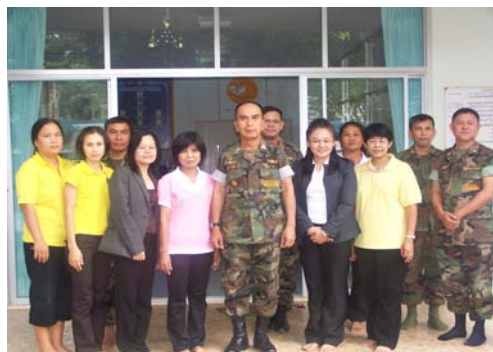
ภาพที่ บุคลากรจากโรงพยาบาลแม่สอด จังหวัดตากถ่ายภาพร่วมกับพลเรือโทสุวิทย์ ชาระรูป ผู้บัญชาการหน่วยบัญชาการนาวิกโยธิน และเจ้าหน้าที่ศูนย์นมแม่ฯ