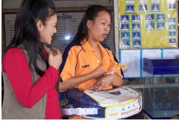
ภาพที่ 3 แม่อาสาในกลุ่มนมแม่ฝึกทักษะการเป็นวิทยากรสอนสาธิต ทำอุ้มทารกกินนมแม่ที่ถุกวิธี

3.3 การฝึกทักษะจริงในการเป็นวิทยากรช่วยในชุมชน ในการจัดอบรมเชิงปฏิบัติการให้แก่แม่อาสาในกลุ่มนมแม่ขององค์การบริหารส่วนตำบลเกาะขวาง ในวันที่ 25 พฤศจิกายน และวันที่ 3 ธันวาคม พ.ศ. 2549 โดยเป็นวิทยากรสอนและสาธิตทักษะพื้นฐานในการเลี้ยงลูกด้วยนมแม่ โดยแม่อาสาในกลุ่มนมแม่และพ่ออาสาที่เป็นข้าราชการทหารในโครงการฯ ได้ แบ่งกลุ่มฝึกทักษะให้แก่ แม่อาสาในกลุ่มนมแม่ ที่เข้าประชุมทั้งหมด 35 คน