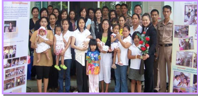
ภาพที่ คณะศึกษาดูงานจากโรงพยาบาลปากพลี มาศึกษาดูงานการดำเนินงานในโครงการแม่อาสา กลุ่มนมแม่ฯในพื้นที่ค่ายตากสิน ในวันที่ 14 มีนาคม พ.ศ. 2551